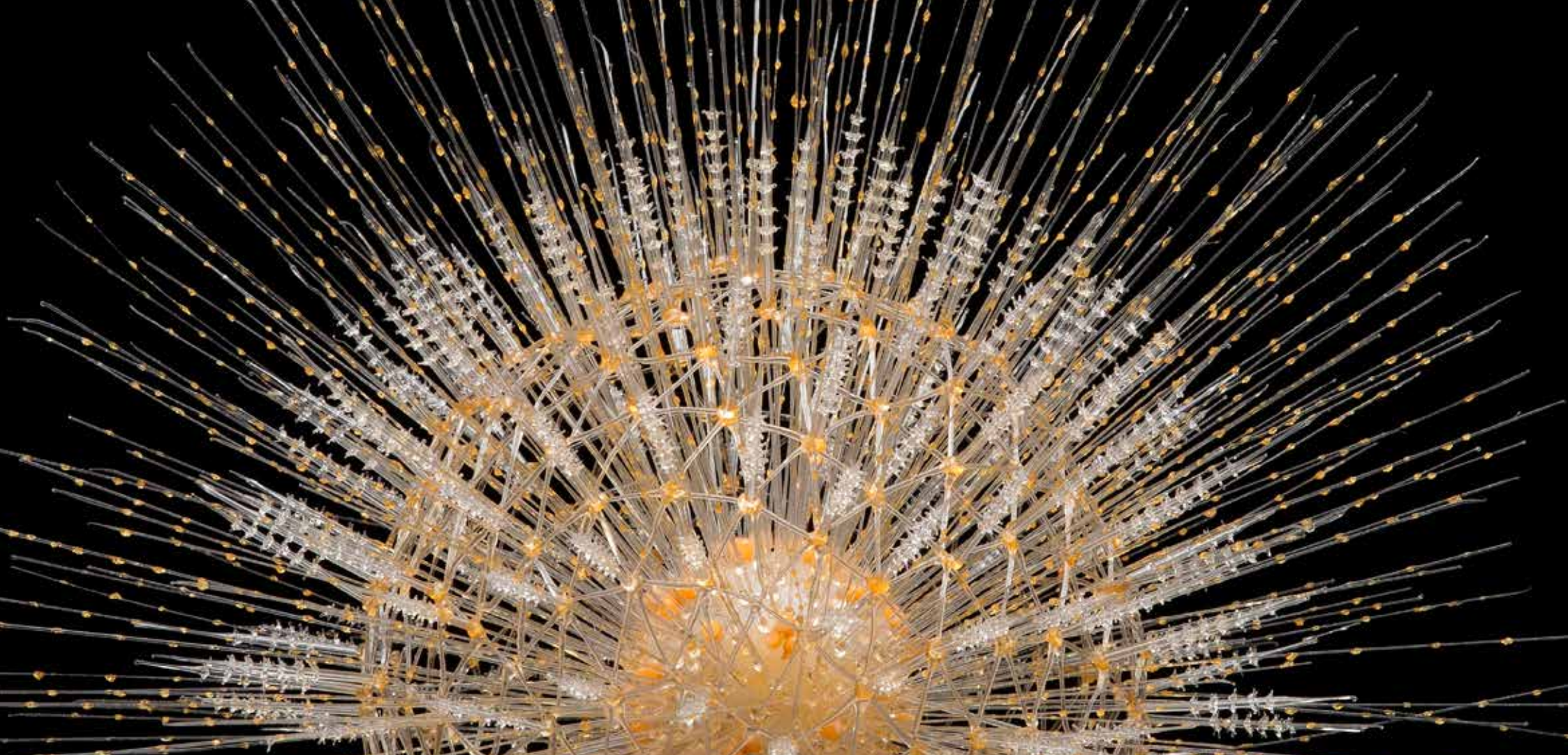
Bild außen: Glasmodell eines Strahlentierchens (Radiolarie), um 1885, Leopold und Rudolf Blaschka, Dresden, Zoologische Sammlung der Universität Tübingen Bild innen: Baukasten Chemie, 1926, Kosmos Stuttgart, Chemisches Zentralinstitut der Universität Tübingen Redaktion und Gestaltung: AG Kommunikation

GESELLSCHAFT ■■■■■ FÜR ■■■■■■■■■■ UNIVERSITÄTS ■■■■■ SAMMLUNGEN ■■■■■■■■